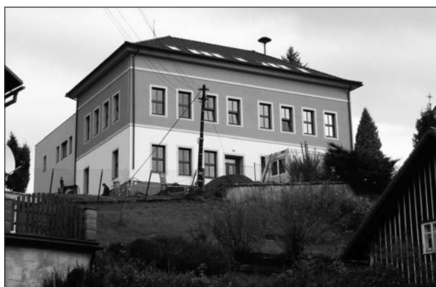
Škola po rekonstrukci.

Galerie koupí obrazy, sochy, betlém, knihy, mince, bankovky, vyznamenání.