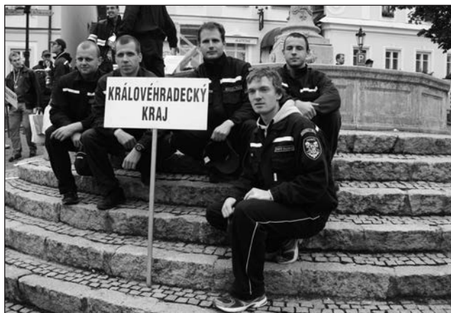
□ Mistrovství ČR dobrovolných hasičů v T.F.A. ve Štamberku.