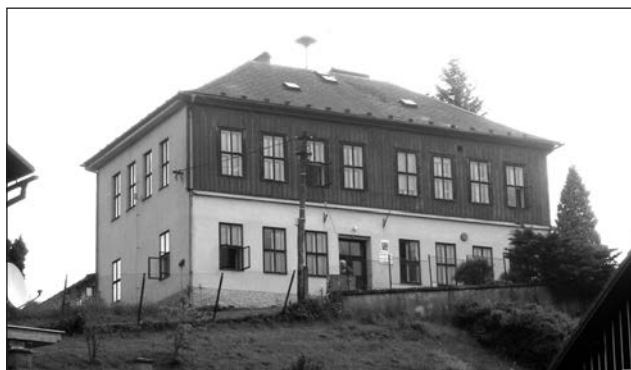
Škola před rekonstrukcí.

V letním čísle Horského kurýra jsme Vám přinesli informace a fotografie z velké přestavby školy v Pěčíně. Za neuvěřitelně krátkou dobu vzhledem k rozsahu rekonstrukce se podařilo koncem září budovu zkolaudovat. Za (pouhé) čtyři měsíce byly dřevěné zdi patra objektu nahrazeny zděm, byly vybourány dřevěné stropy a nahrazeny za monolitickou betonovou desku, udělala se nová střecha a střešní konstrukce včetně vybudování podkrovních učeben. Rozšířilo se sociální zařízení, vybuďoval se nový přístup do budovy, včetně bezbariérového, nová elektroinstalace, část rozvodu topení, zateplení budovy a výměna oken a dveří. Začátkem října se do nových krásných prostor vrátily děti. Podle slov ředitelky školy Mgr. Věry Duškové je ve škole stále spousta práce. Stěhují se zpět věci, které byly uloženy mimo školu, učební pomůcky se rovnají do kabinetů, skříní, polic atd. Dále ještě probíhají venkovní úpravy. A až to všechno bude hotové, rádi by Vás zaměstnanci školy spolu s dětmi a vedení obce pozvali na Den otevřených dveří. Ten se plánuje na polovinu listopadu 2014. V příštím vydání kurýra se můžete těšit na fotoreportáž z nových prostor pěčínské školy. ZS