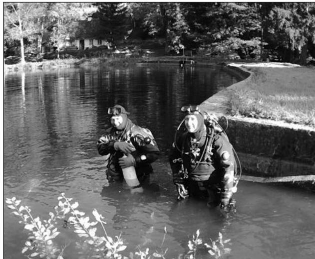
☐ Potápění na koupališti letos v září.