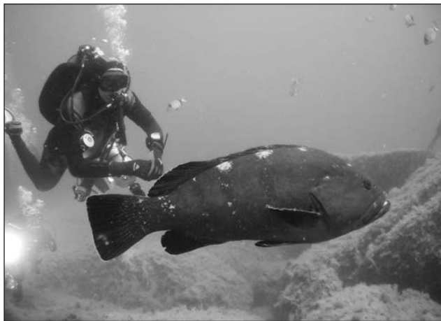
☐ Potápění na Korsice.