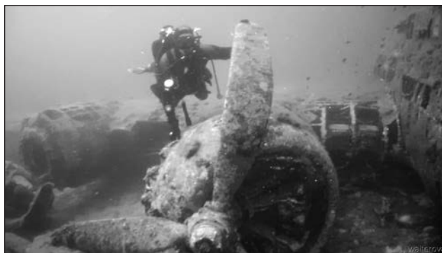
☐ Přítel u vraku letadla B-17 z 2. sv. války. Ten leží u přístavu Ajacio na Korsice. V tomto případě pilot letounu přežil. Fotka je z července 2014.