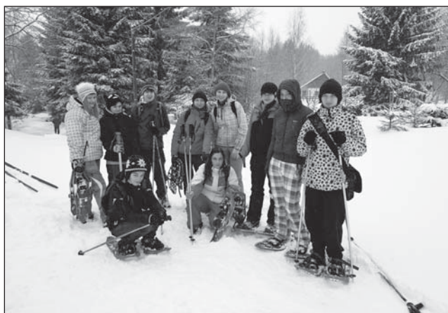
Dívky lyže 7. - 9. třída