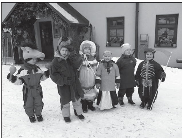
□ Masopustní průvod bartošovických dětí

Mimo lyžování se děti připravovaly na „přijímačky“ - zápis do Základní školy v Rokynici. Celoroční příprava předškoláků se ukázala jako velmi dobrá. Celkem jich v září nastoupí do první třídy šest. Doufáme, že mateřské školce Bartošovice neudělají ostudu. Příprava na školu nebyla jediná. 8. února si děti užívaly masopustní rej. Připravily si masky a vyrazily do obce na koledy. Za svá vystoupení byly děti bartošovickými bohatě odměněny. Od 11. února některé děti s dalšími školáky jezdí do rychnovského bazénu na zdokonalovací plavání. A tam se nejen učí správným plaveckým pohybům, ale i se vyřádí na tobogánu, divoké řece a dalších atrakcích bazénu. Ve školce se už teď těší na jaro a připravují Velikonoce. Ty tu budou co nevidět a tak je čeká plnění pomlázek a nácvků nových koled.