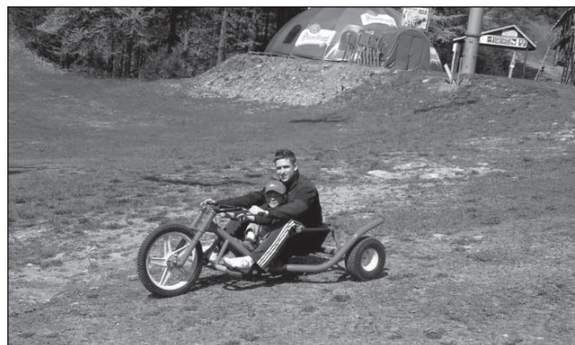
□ Letní provoz lanové dráhy umožňuje sjezdy na koloběžkách a tříkolkách.

Ale abych odpověděl na otázku. Nové nápady a inspiraci samozřejmě máme, jedná se např. o půjčování handbiků, crossových vozíků pro ZTP, dětské hřiště, tělocvičnu pod širým nebem, apod. K realizaci mnohých z nich je však potřeba většího prostoru. I v tomto směru vedeme jednání a pevně věříme v dohodu.