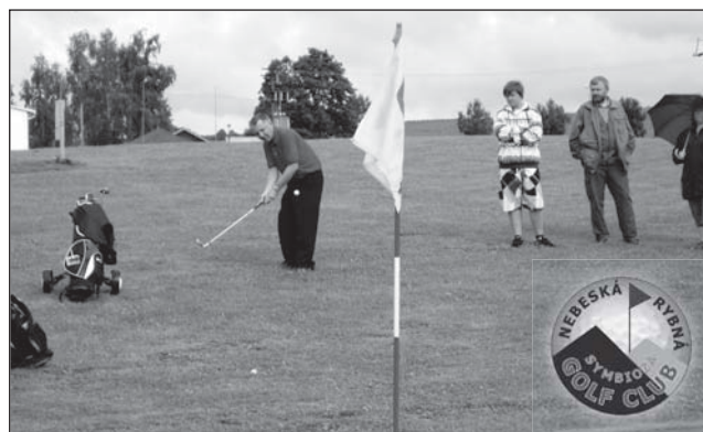
□ Ilustrační foto

Tato možnost se už v budoucnu nebude opakovat. Máme i tzv. rodinné vstupné. Princip je ten, že druhý a další