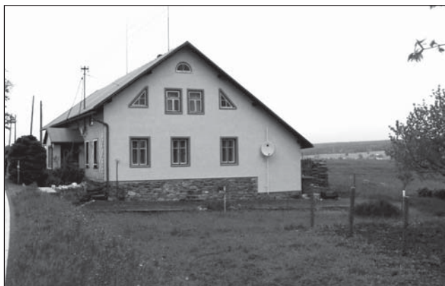
□ Eternitový obklad stavby byl nahrazen omítkou v nevhodném křiklavě žlutém barevném odstínu (pozn. pro černobílý tisk: stavba byla původně obložena šedými neutrálními eternitovými šablonami, štítová stěna a kryté zádveři jsou nyní opatřeny kanárkově žlutou fasádou).

Barevný odstín určitě volte světlý pastelový, protože novodobé omítky jsou barevně velmi stálé a svoji barevnost si udržují po dlouhou dobu. Mohu vám poskytnout malou radu: i když se vám odstín barvy ve vzorníku zdá vhodný, mějte na paměti, že ve velké ploše bude barva působit mnohem výrazněji (sytěji). Pokud váháte mezi dvěma odstíny, volte raději ten světlejší.