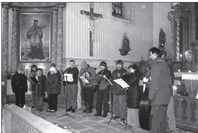
□ Rokytnický Sbor z hor na koncertě v říčkovském kostele.