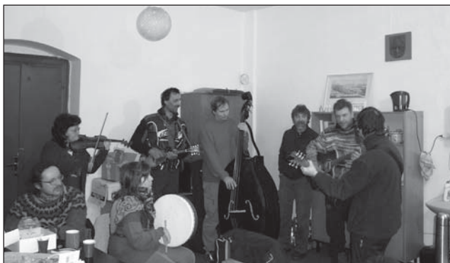
□ Hráť a zpívat se dá i na „úřední půdě“.