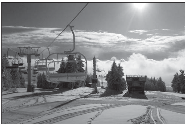
□ Horní stanice lanovky v lyžařském areálu.