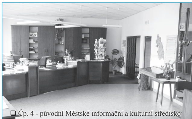
□ Čp. 4 - původní Městské informační a kulturní středisko

Na počátku roku 2014 došlo k tomu, o čem se dlouho v Rokycnici diskutovalo, totiž k přestěhování Městského kulturního a informačního střediska z růžového domu čp. 4 do Domu služeb čp. 68. Stěhování probíhalo během měsíce ledna a nové prostory byly otevřeny 10. února. Stále však probíhá „doladování“ v obou domech. Akci stěhování si postupně fotíme a nabízíme ochutnávkou. vj