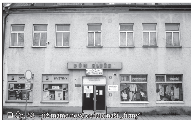
□ Čp. 68 – již máme nové cedule naší „fimy“