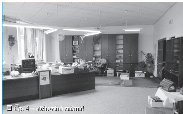
□ Čp. 4 – stěhování začíná!