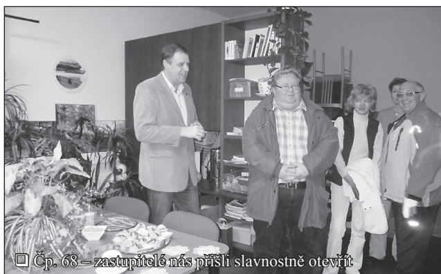
□ Čp. 68 – zastupitelé nás přišli slavnostně otevřít