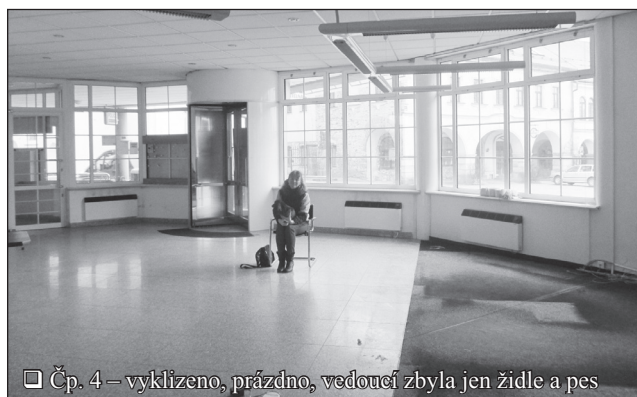
□ Čp. 4 – vyklizeno, prázdné, vedoucí zbyla jen židle a pes