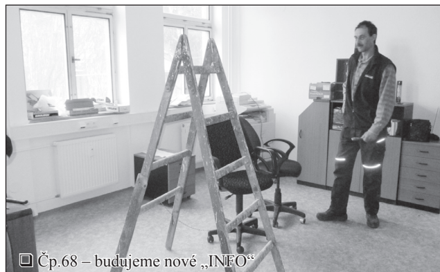
□ Čp.68 – budujeme nové „INFO“