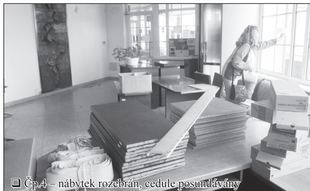
□ Čp.4 – nábytek rozebrán, cedule posundávány