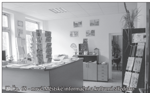
□ Čp. 68 - nové Městské informační a kulturní středisko