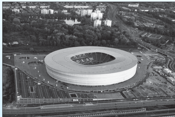
❑ Fotbalový stadion ve Wroclavi, kde se odehrají zápasy českého týmu v EURO 2012.