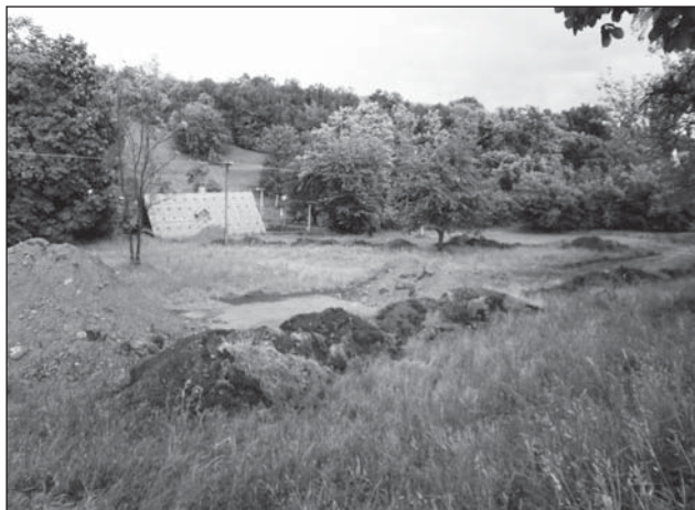
❑ Vznikající dirty - park na louce pod nákupním střediskem.

„Nejdříve bychom chtěli seznámit spoluobčany s tím, co si pod slovem dirty - park představí. Jsou to prostě skoky z hlíny, které slouží pro provozování speciálního druhu sportu (BMX, MTB). V okolí zde nic takového není, tak proč to nezměnit. Mys-