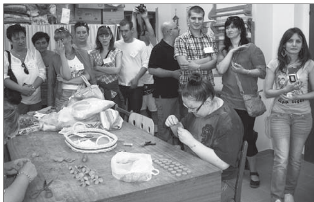
☐ Výroba pomněnkových kvítků v chráněných dílnách Kopeček v Bartošovicích.