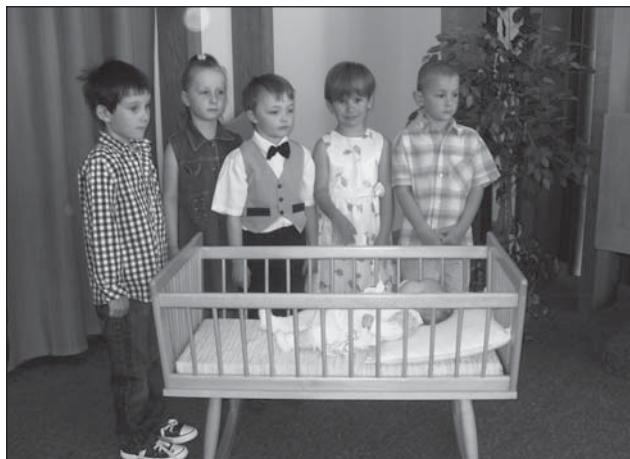
☐ Novým občánkům přišly zazpívat a zrecitovat děti z Mateřské školy v Rokytnici.