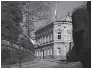
Informace z jednání rady města dne 22.4.2013 zkrácený výpis

Kompletní text Usnesení rady města je uveden na internetových stránkách města www.rokytnice.cz nebo k nahlédnutí na Městském úřadu v Rokytnici v Orlických horách