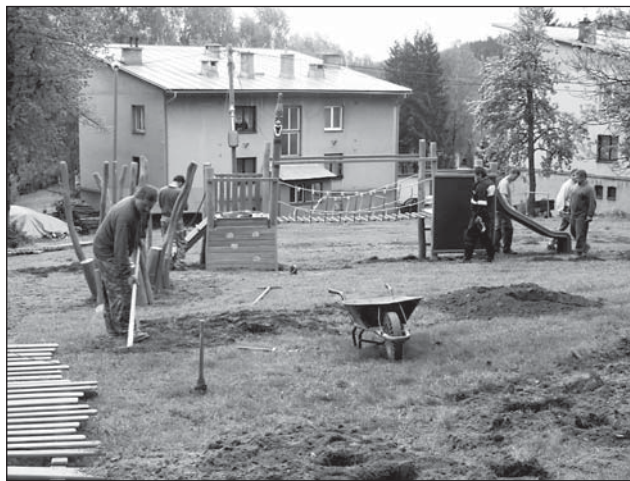
☐ Při stavbě hřiště pomáhali dobrovolníci, za což jim patří velký dík.