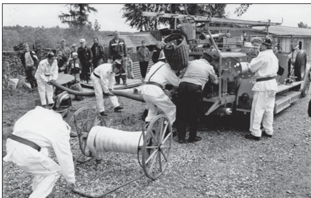
□ Ukázka staré techniky hasičů ze Solnice na hřišti