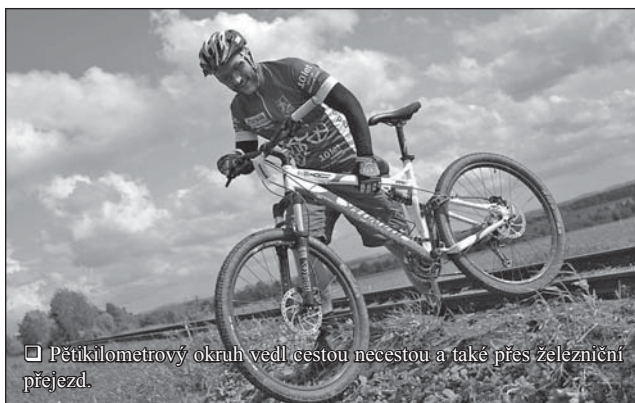
□ Pětakilometrový okruh vedl cestou necestou a také přes železniční přejezd.