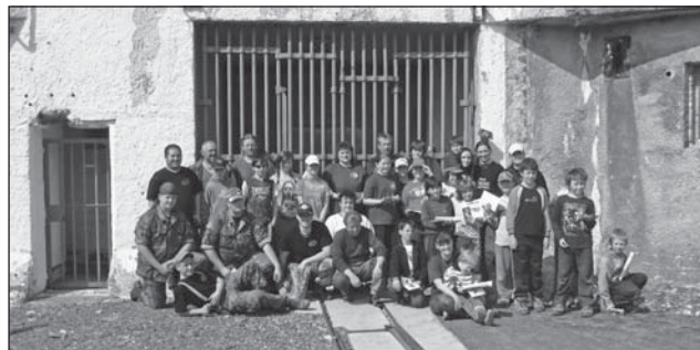
□ J. Zimmer, Více na www.hasiciroknytnicevoh.ic.cz