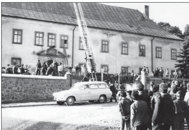
□ Námětové cvičení na rokytnický zámek